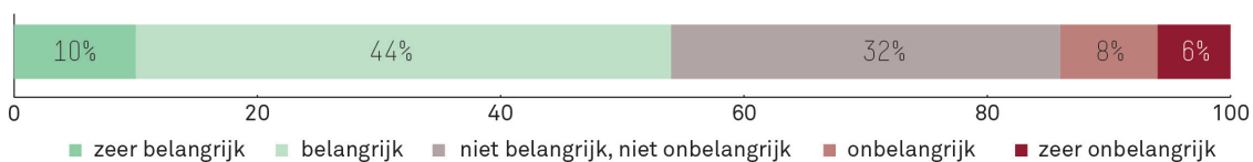
FIGUUR 3. In hoeverre vindt u het belangrijk of onbelangrijk dat rijke landen met elkaar afspreken hoeveel geld ze aan ontwikkelingshulp besteden? (n=1002).