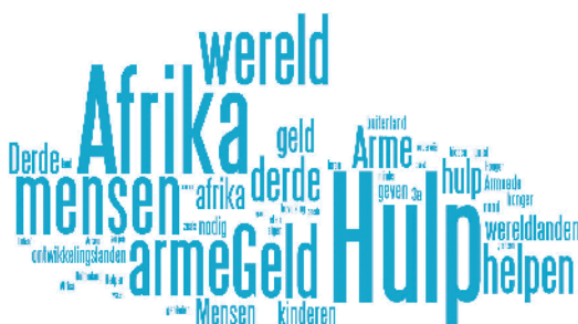
Figuur 1. Wat is het eerste waar u aan denkt bij de term ontwikkelingshulp ?

Maar boven alles blijkt de nadruk bij internationale samenwerking, veel meer dan bij de andere twee termen, op samenwerking te liggen. Internationale samenwerking lijkt dus meer geassocieerd te worden met een gelijkwaardige uitwisseling dan in het geval van ontwikkelingshulp en ontwikkelingssamenwerking.