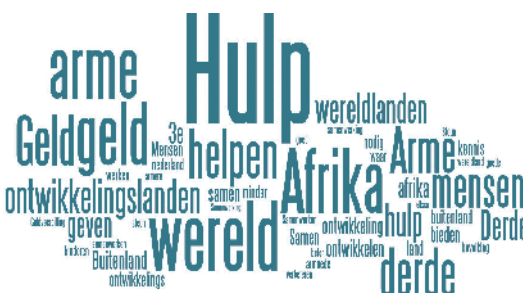
Figuur 2. Wat is het eerste waar u aan denkt bij de term ontwikkelingssamenwerking ? (wordle.net)