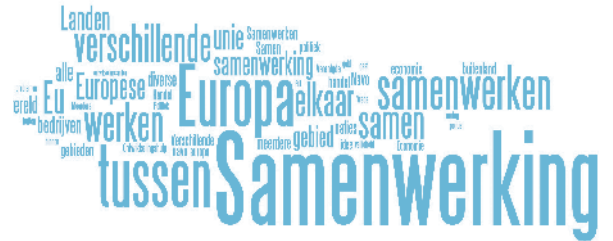
Figuur 3. Wat is het eerste waar u aan denkt bij de term internationale samenwerking ? (wordle.net)