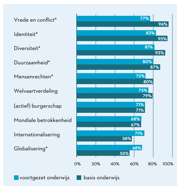
Figuur 1: Aandeel leraren dat incidenteel of structureel aandacht besteedt aan thema's van wereldburgerschap (bo: n = 455; vo: n = 991).

* = Significante verschillen tussen basis- en voortgezet onderwijs ( p < 0,05 ).